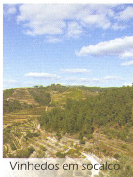
Vinhedos em socalco

Chegados à aldeia de Paradela, podemos apreciar toda uma imensidão de cores e aromas que não passam despercebidos aos nossos sentidos e à medida que pedalamos, por caminhos e veredas, somos testemunhas da beleza que nos rodeia.