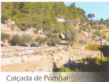
Calçada de Pombal

O Percurso "Rota por Trilhos Vinhateiros" destina-se a ser percorrido em bicicleta de todo-o-terreno (BTT). Para cumprirmos o itinerário deveremos seguir a marcação azul (que se destaca na paisagem), composta por dois círculos e por um triângulo indicando a direcção a seguir.