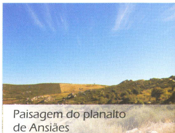
Paisagem do planalto de Ansiães

Continuamos e subimos até ao núcleo rural de Pombal, pela antiga calçada, um belo carreiteiro com as suas lajes marcadas pelo passar do tempo. Atravessamos a aldeia por quelhas sombrias, para a escassos metros encontramos novamente a estrada que seguimos até à aldeia de Pinhal do Norte. Daqui o percurso torna-se mais exigente, apresentando subidas de algum desnível, nada que em equipa ou com um bom espírito de aventura não se ultrapasse. Passado algum tempo chegamos ao sítio de Felgueira, trata-se de um pequeno lugar habitado por apenas duas