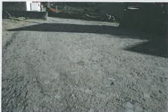
Arruamentos na Freguesia de Carrazeda de Ansiães Participação à Junta de Freguesia : 13.500,00 €