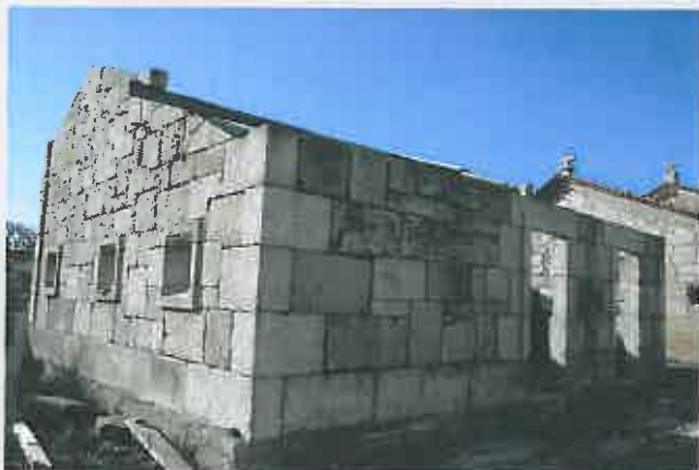
Casa Mortuária em Mogo de Malta

Comparticipação à Junta de Freguesia : 13.500,00 €