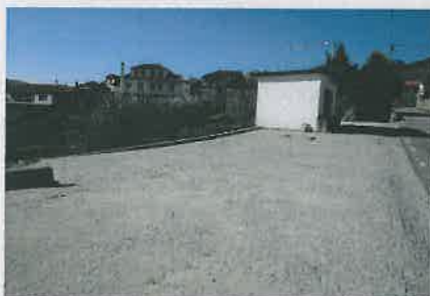
Arruamentos na Freguesia de Pombal

Comparticipação à Junta de Freguesia : 13.500,00 €