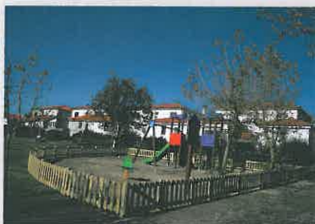
Parque Infantil Bairro da Telheira Investimento: 12.992,80 €