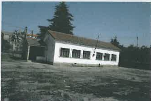
Adaptação da Escola de Seixo de Ansiães para Centro de Convívio