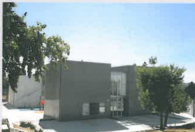
Centro Escolar - Instalação de Painéis Fotovoltaicos