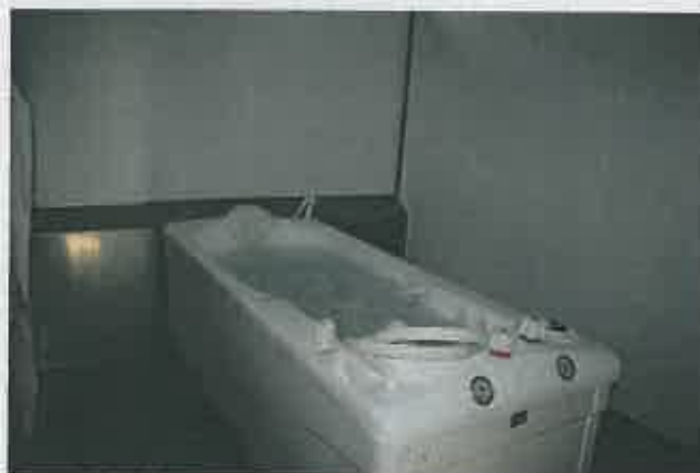
Caldas de S. Lourenço - Montagem de Pavilhão para o Estudo Médico Hidrológico

Pavilhão: 83.640,00 € Forn. e Mont. Equipamento para Captação da Água Termal: 90.405,00 € Mobiliário: 33.656,34 €