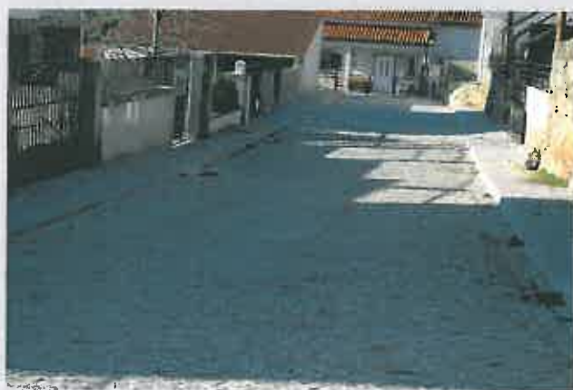
Arruamentos na Freguesia de Beira Grande

Comparticipação à Junta de Freguesia: 13.500,00 €