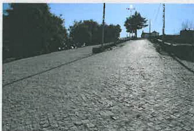
Arruamentos na Freguesia de Castanheiro

Comparticipação à Junta de Freguesia : 13.500,00 €