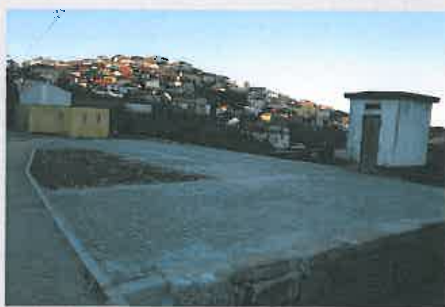
Arranjo do Largo do Cano em Vilarinho da Castanheira

Comparticipação à Junta de Freguesia / 13.500,00 €