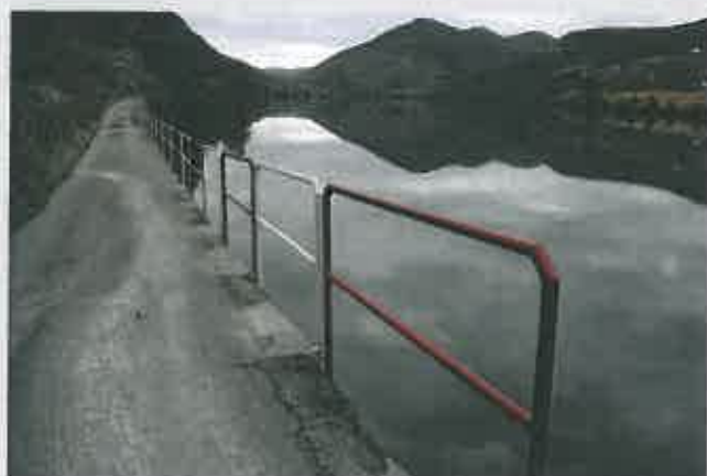
Colocação de Gradeamento Rio Douro / Senhora da Ribeira