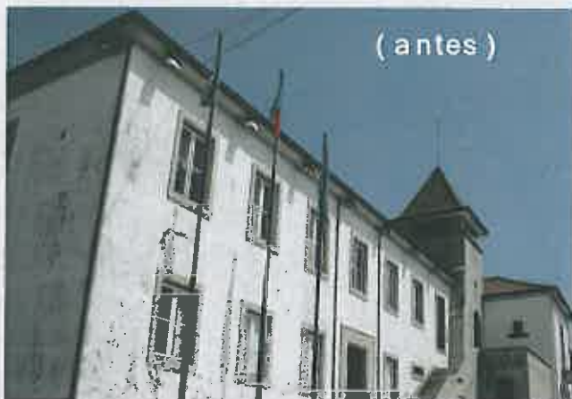
( antes )