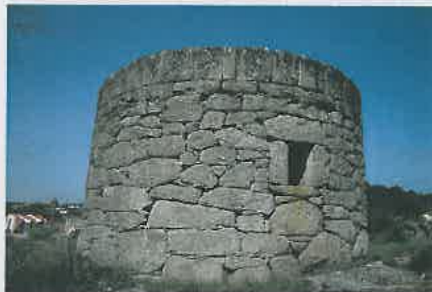
Recuperação do Moinho de Vento em Carrazeda de Ansiães