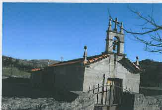
Iluminação Cénica da Capela de Areias Custo: 6.882,83 €