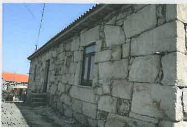
Adaptação da Escola de Castanheiro do Norte para Centro de Convívio Valor da adjudicação: 37 434,25 €