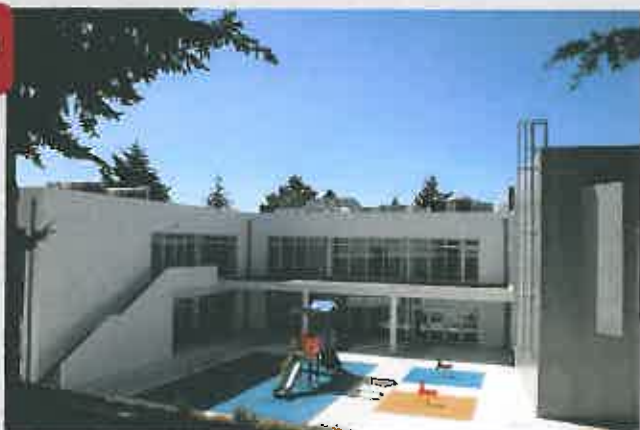
Centro Escolar - Cobertura da Rampa de Acesso e Cobertura do Pátio