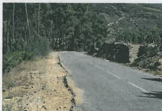
Requalificação do Caminho 1130 Castanheiro / Tralhariz Valor da adjudicação: 211.876,77 €