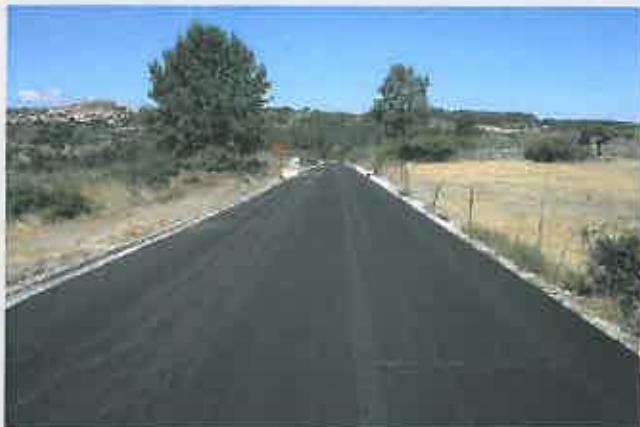
Requalificação da EN 324 limite do Concelho de Vila Flor, limite do Concelho de Torre de Moncorvo Custo: 567 284,30 €