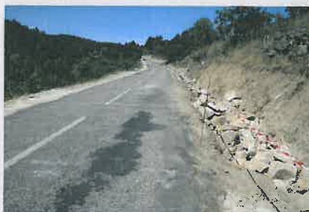
Requalificação da VM2 - Marzagão / Estrada Municipal Linhares / Valeira Valor da adjudicação: 376.788,50 €