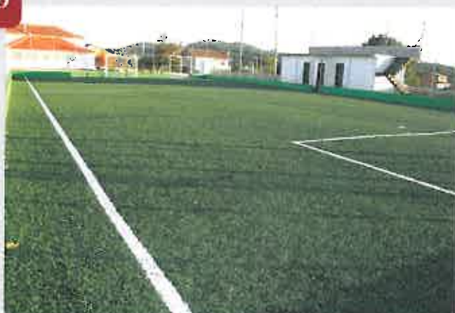
Beneficiação do Polidesportivo de Parambos Comparticipação à Junta de Freguesia / 13.500,00 €