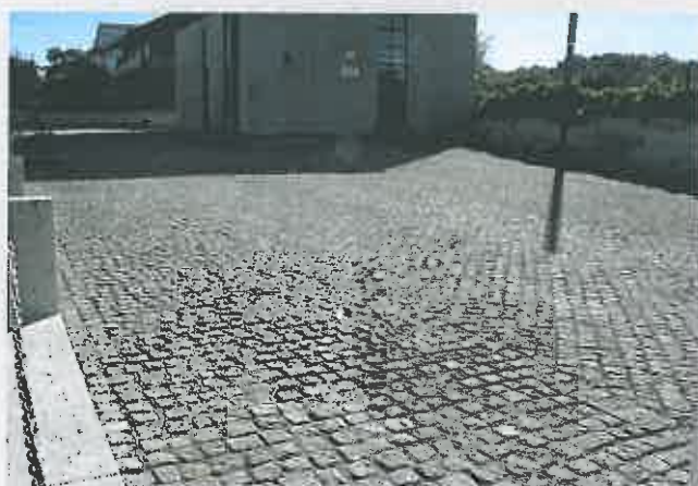
Arranjo da área envolvente da Associação de Mogo de Ansiães Comparticipação à Junta de Freguesia / 12.132,61 €