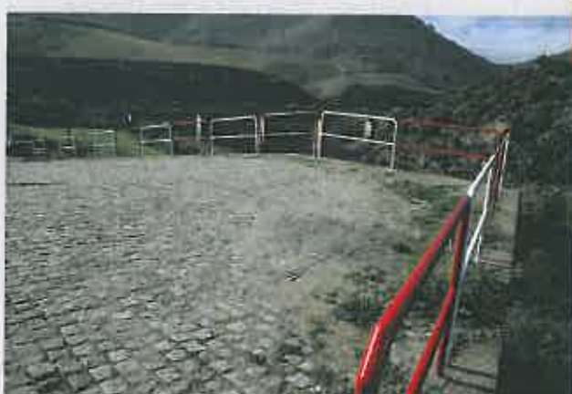
Colocação de Gradeamento Foz - Tua