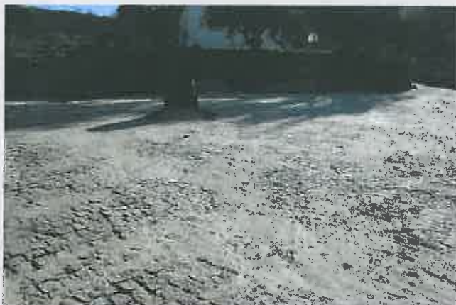
Arruamentos na Freguesia de Amedo

Comparticipação à Junta de Freguesia : 13.500,00 €