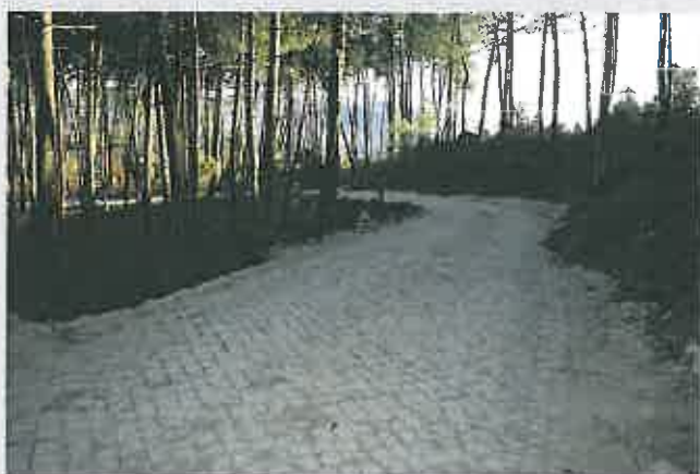
Arruamentos na Freguesia de Linhares

Comparticipação à Junta de Freguesia / 13.500,00 €