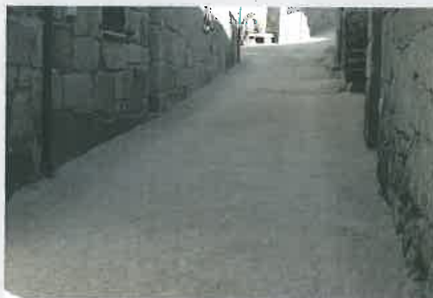
Arruamentos na Freguesia de Pereiros

Comparticipação à Junta de Freguesia : 13.500,00 €