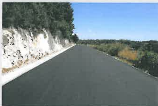
Requalificação do Caminho Municipal 1141 Fontelonga - Penafria Custo: 290.991,48 €