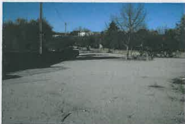
Arruamentos na Freguesia de Selores

Comparticipação à Junta de Freguesia : 6.882,83 €