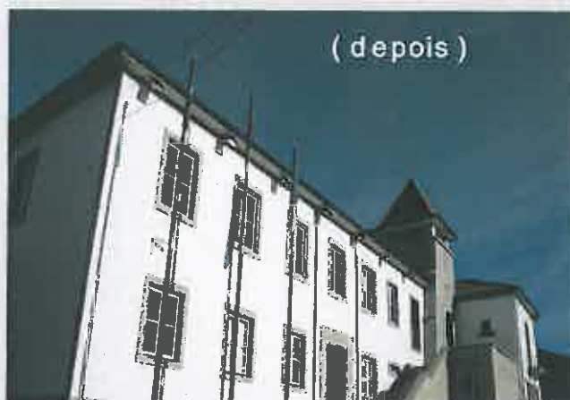
( depois )