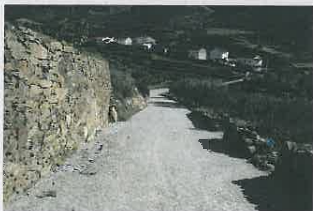
Arruamentos na Freguesia de Ribalonga

Comparticipação à Junta de Freguesia : 13.500,00 €