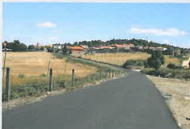
Requalificação da Estrada Municipal 1142 Fontelonga - Besteiros Custo: 183.182,19 €