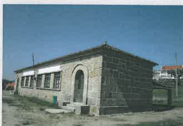
Adaptação da Escola de Linhares para Centro de Convívio Valor da adjudicação: 73 500,07 €