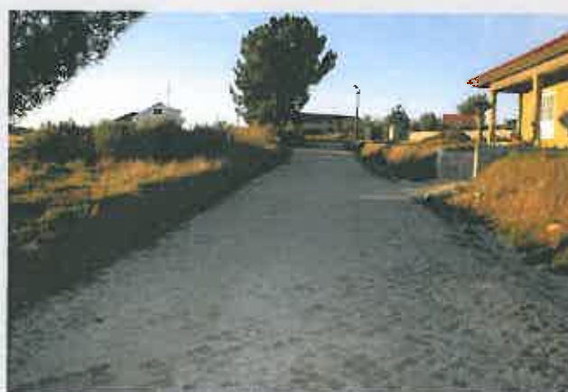
Arruamentos na Freguesia de Marzagão

Comparticipação à Junta de Freguesia : 13.500,00 €