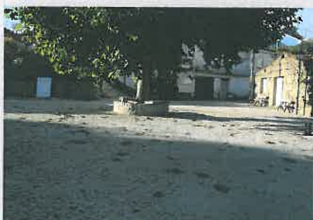
Arruamentos na Freguesia de Pinhal do Norte Comparticipação à Junta de Freguesia / 10.628,57 €