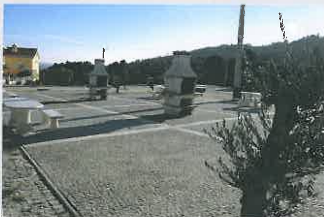
Largo da Sede da Junta de Freguesia de Lavandeira

Comparticipação à Junta de Freguesia : 13.500,00 €