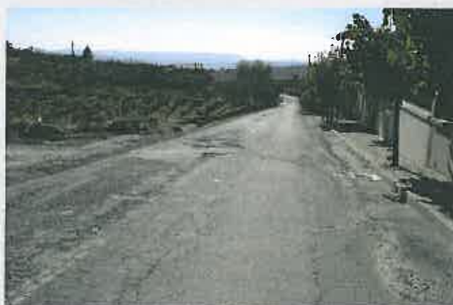
Requalificação da EM 632 - Seixo de Ansiães - Beira Grande Valor da adjudicação: 86.957,51 €