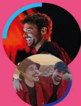
INSERT COIN KURA DJ 30 AGO

MAÇÃ . VINHO . AZEITE . GASTRONOMIA . MÚSICA . ANIMAÇÃO . MERCADO DE PRODUTORES